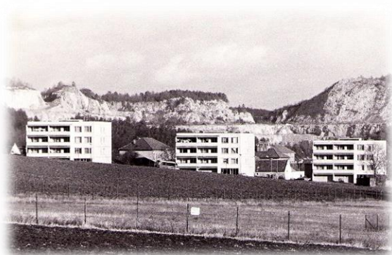
Nové sídliště (1983)

Severně nad těmito pozemky bylo v roce 1983 vystavěno Nové sídliště – bytové sídliště s 54 byty, určenými (v souvislosti s tehdy uvažovanou výstavbou nové cementárny poblíž VČS) převážně pro zaměstnance VČS a KDC.