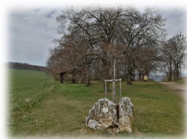
Světlice (V lipkách)

Tolik tedy pro dnešek o západním okolí Tmaň a Lounína.