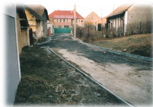
Konec ulice V koutě v roce 2003 krátce před dokončením jejího bezprašného povrchu

Sídliště bylo napojeno na stávající komunikaci dvěma novými spojkami – jednak z výše uvedené části V koutě , jednak odbočkou z tmaňské návsi v místě naproti hostinci U Boušků, kde dřív stával dům čp. 79 a v němž původně bydleli sourozenci Bedřich a Pavla Zítkovi.