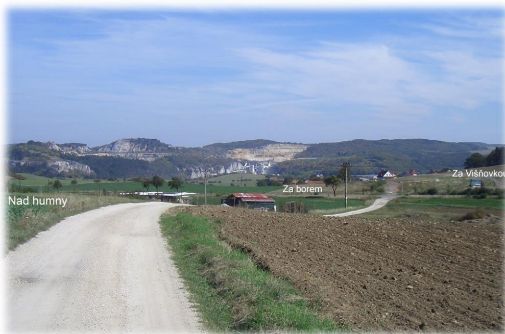
Snímek je ze září 2007, dnes jeho okolí vypadá podstatně jinak.

Dnes zastavěné polnosti mezi levou stranou Travnatky a Višňovkou nesou příhodný místopisný název Za Višňovkou , trojúhelník polí vymezený pravou stranou Travnatky, silnicí z Lounína ke Křižatkům a polní cestou ke sběrnému dvoru má název Za borem .