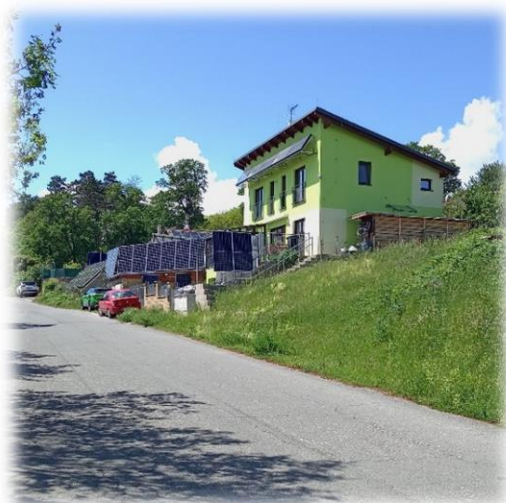
Na levé fotografii asi z roku 1940 vidíte dvě fešandy – vlevo moje teta, vpravo maminka. V levé části snímku je za nimi vidět Vykopávka, jak vypadala prakticky až do roku 2007, na pravém snímku je dům, postavený dnes zhruba na jejím místě.

3b. Pokud bychom ještě ve Tmani u domu číslo 66 odbočili doprava ulicí Na boru , dojdeme k nejmladší tmaňské ulici, pojmenované Travnatka (nové p.č.121/10) .