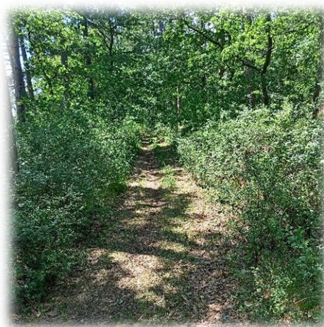
Lesní cesta ve Višňovce